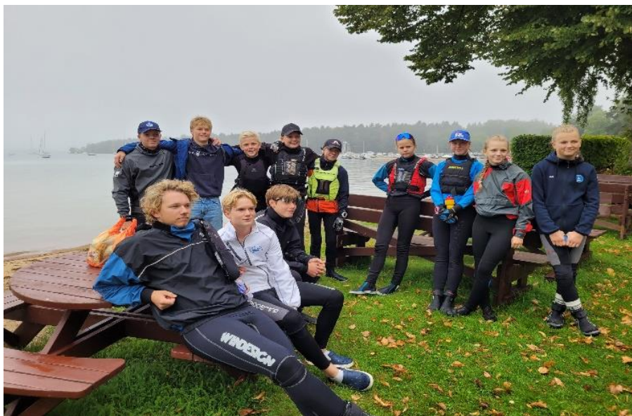
Team LjSS RS Aero och Tera SM Motala 26-27/8 2023