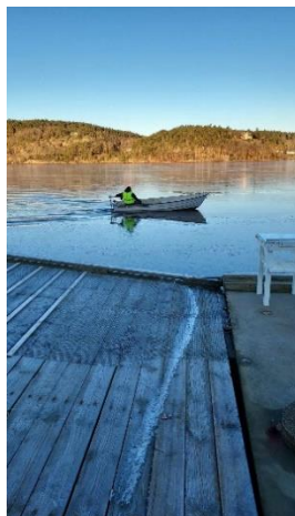
Ymer 2 i isbrytararbete