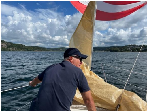
Sten letar vindar, ström och konkurrenter?