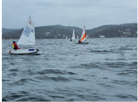
Deltagarna var fördelade i flera olika klasser

För en endagarsregatta som Majbrasan så är det bättre att 1 maj ligger mitt i veckan utan koppling till någon anliggande riksrankinghelg, med avseende på totala deltagarantalet.