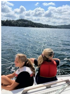
Lovisa o Paula njöt i solen

Häng på du också och segla Röva Runt 3 augusti 2024!