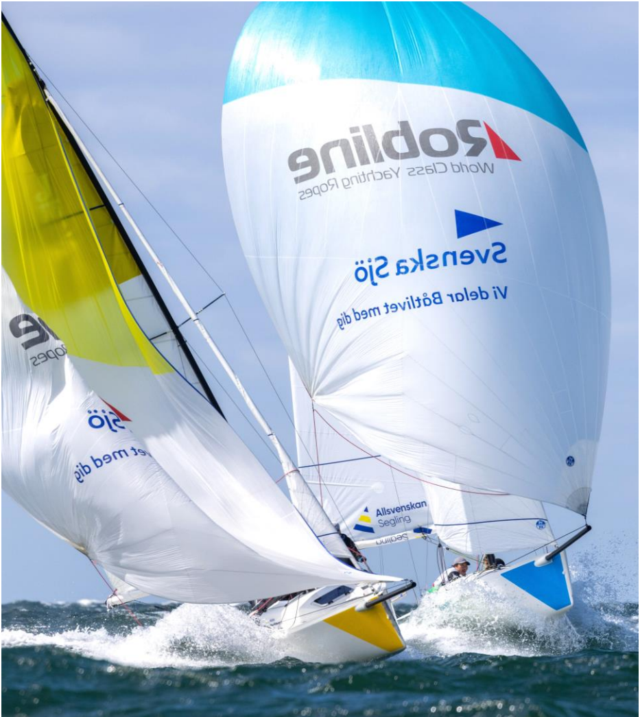
Stilstudie av LjSS egen ljusblå Marianne på vild undanvind i Skanör.