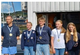
Prispallen KM 2023

Väldigt lätta vindar, till en början stundtals obefintliga inledde förmiddagen.