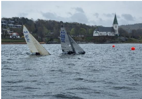
Två LjSS-deltagare på väg mot kryssmärket